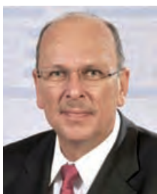
Stefan Grüttner Hessischer Sozialminister

Die nachfolgende Broschüre erläutert zunächst die Instrumente, mit deren Hilfe Sie selbstbestimmt vorsorgen können und stellt sodann die wesentlichen Inhalte der rechtlichen Betreuung, einschließlich des rechtlichen Verfahrens und der Aufgaben der betreuenden Person dar.