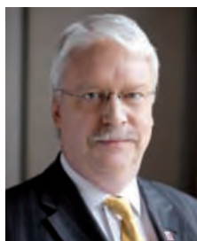
Jörg-Uwe Hahn Hessischer Minister der Justiz, für Integration und Europa